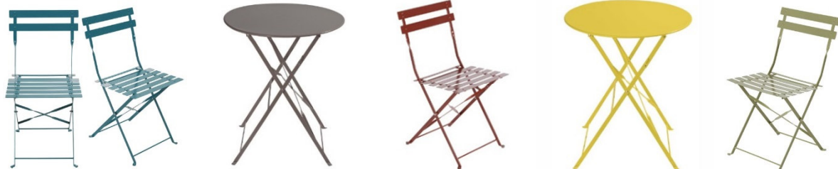
Abbildungen: Maisons du Monde

Die Gewerbetreibenden konnten in den letzten Wochen ihre Bestellungen für die Tische und Stühle beim Citymanagement aufgeben und dabei aus verschiedenen, am räumlich-gestalterischen Leitbild der Stadt orientierten Farben wählen. So entsteht ein harmonisches und gleichzeitig individuelles und buntes Stadtbild. An dem Projekt ist neben dem Citymanagement auch die Unternehmergemeinschaft „Billerbeckerleben e. V.“ beteiligt. Die Anschaffung der Möbel wird aus dem Verfügungsfonds gefördert – ein attraktives Angebot sowohl für die Geschäftsleute als auch am Ende für die Kunden, die an solch einer Ruheinsel pausieren können.